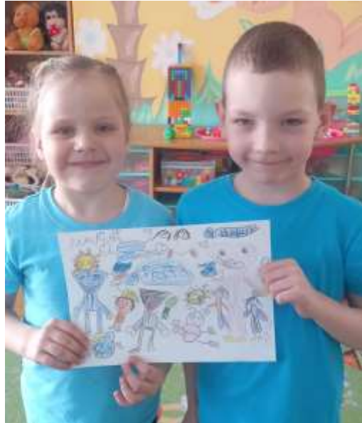
Мой разноцветный день