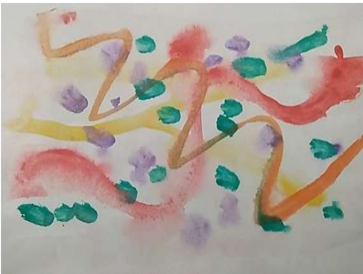
Моя картина эмоций