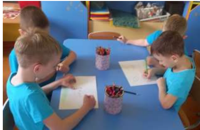
Приключение линии на холсте