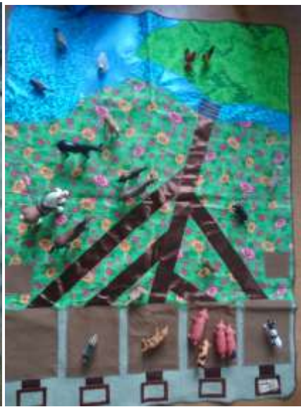
Коврики Зоопарк и Ферма