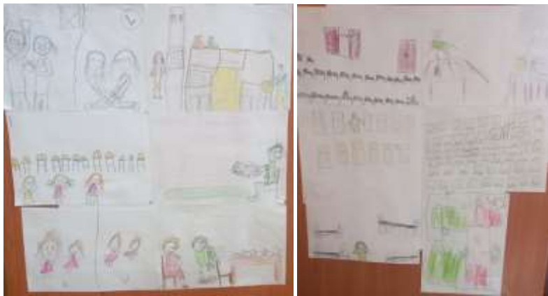
Правила группы, спальни